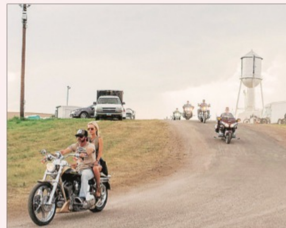
Bikers have been among the groups most loyal to Trump, as motorcyclists tend to be predominantly working-class men over 50 and veterans — demographics that comprise the bulk of the president's base.

porters said they understood the economic rationale behind Harley's decision. Few complex machines are fully sourced and assembled in the United States these days, and even the riders who are devoted to the idea of a fully American-made product said they understood that companies must compete globally.